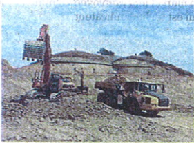
La chambre de vanne à Trémouilles sera rénovée.